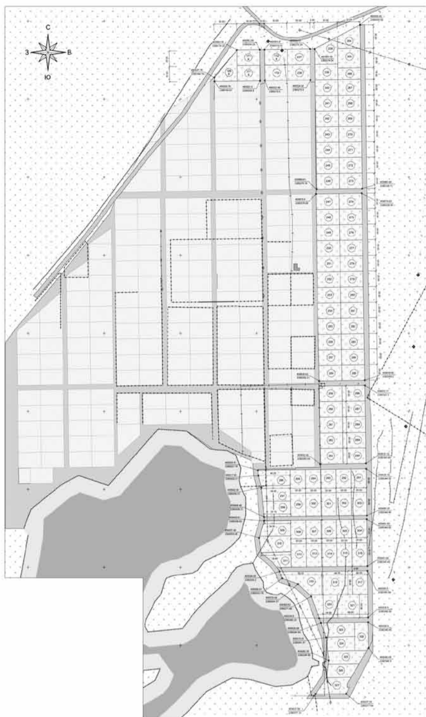
Экспликация земельных участков