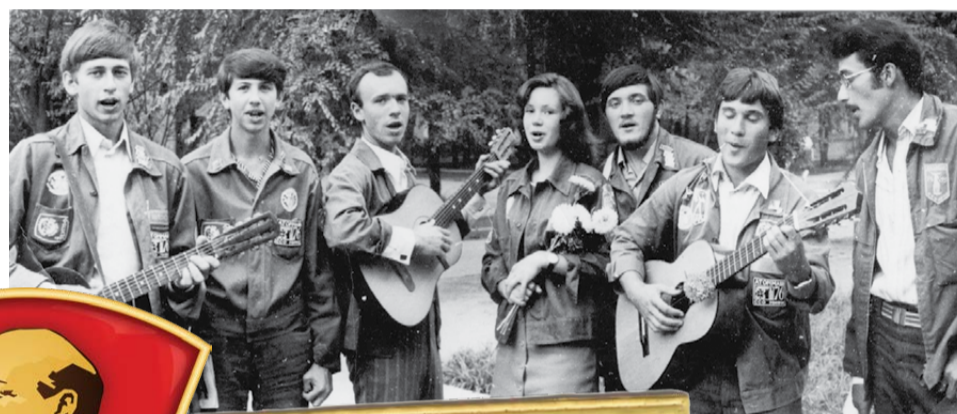
Агитбригада ССО «Хор МИФИ» выступает перед журналистами «Волгодонской правды». Август 1977 г.

Тогда получила широкое распространение работа так называемых «коммунистических отрядов», которые все заработанные деньги перечисляли на какие-либо благо-