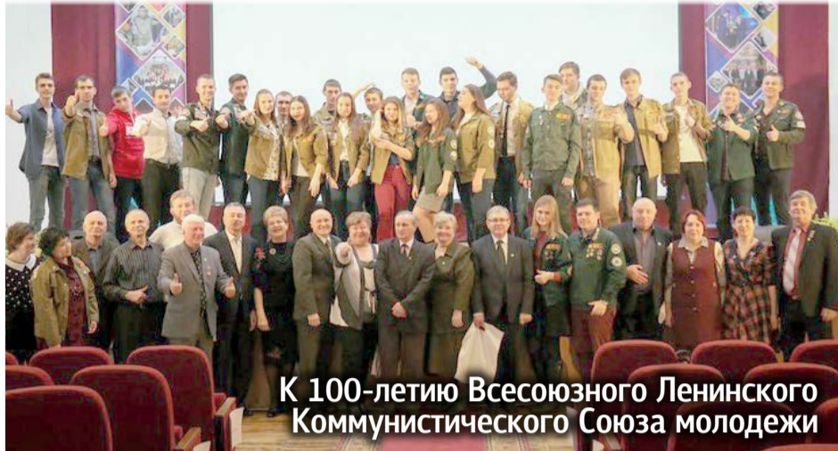
К 100-летию Всесоюзного Ленинского Коммунистического Союза молодежи

В этом году исполняется 100 лет Всесоюзному Ленинскому Коммунистическому Союзу молодежи – молодежной организации, созданной в России в октябре 1918 года. Членами ВЛКСМ за время его существования были миллионы молодых людей в возрасте от 14 до 28 лет (в 1977 году, например, численность ВЛКСМ составляла более 36 миллионов человек).