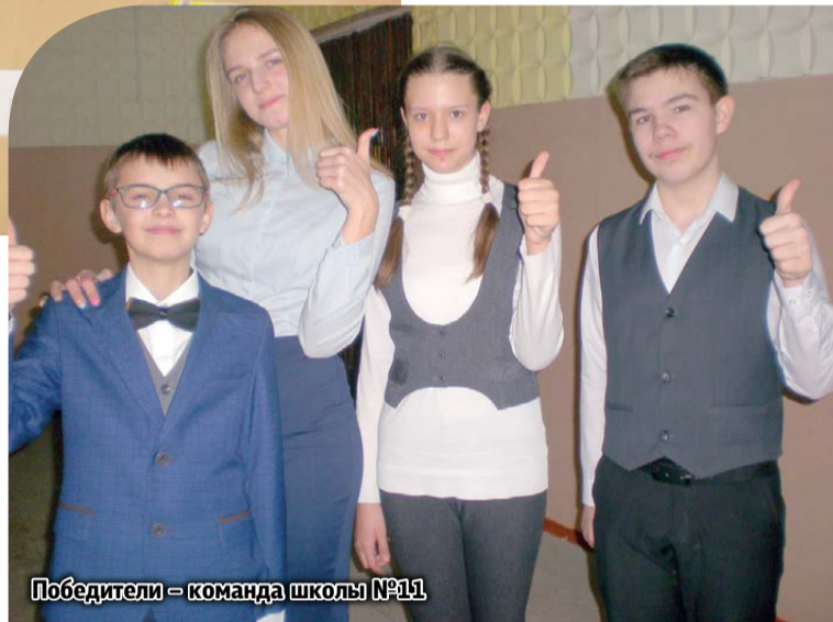
Победители – команда школы №11

V-я метапредметная олимпиада по традиции проходила в школе №13. В единый день на муниципальный этап олимпиады собрались юные эрудиты из 20 городских школ. Участники и гостей встречали хозяева школы – учащиеся старших классов. И как от-