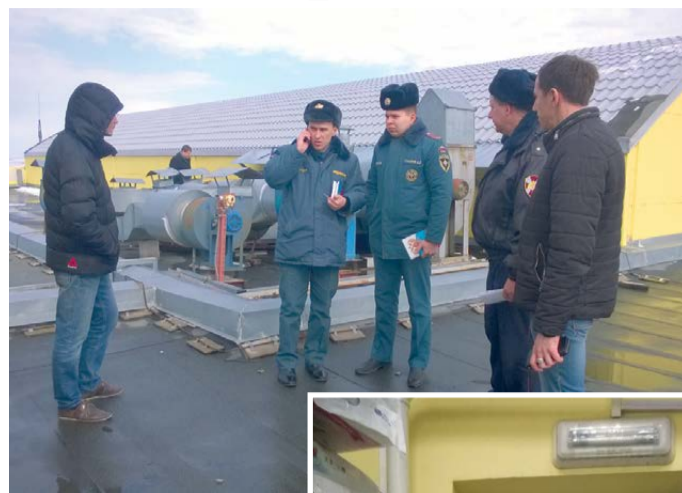
можем. Но можем проводить внеплановые проверки.