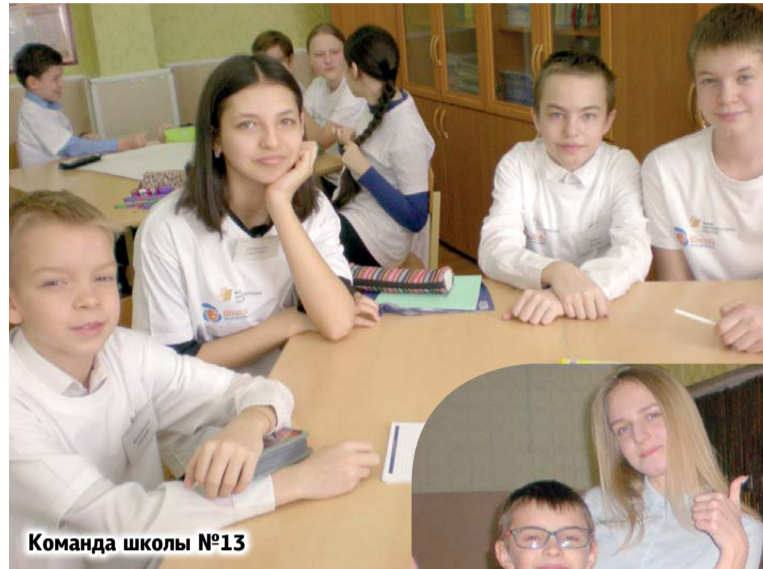
Команда школы №13

В Волгодонске чествовали победителей и призеров муниципальных этапов конкурсов инновационного проекта «Школа Росатома»