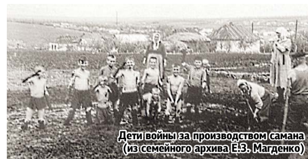
Дети войны за производством самана

А ведь действительно это нужно не только для истории. Шествие детей войны автором идеи задумано и как обращение к нашим законодателям. Поколение людей, у которых война отняла детство, не пользуется социальными льготами. Так, может быть, марш людей, которые в страшное для Родины время маленькими героями приняли на свои плечи недетскую ношу, послужит напоминанием власти и обществу: пора сказать спасибо.