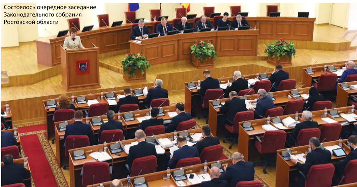
Состоялось очередное заседание Законодательного собрания Ростовской области

– Эти средства идут по всем основным направлениям: здра-